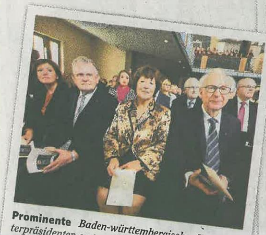
Prominente Baden-württembergischer Ministerpräsidenten