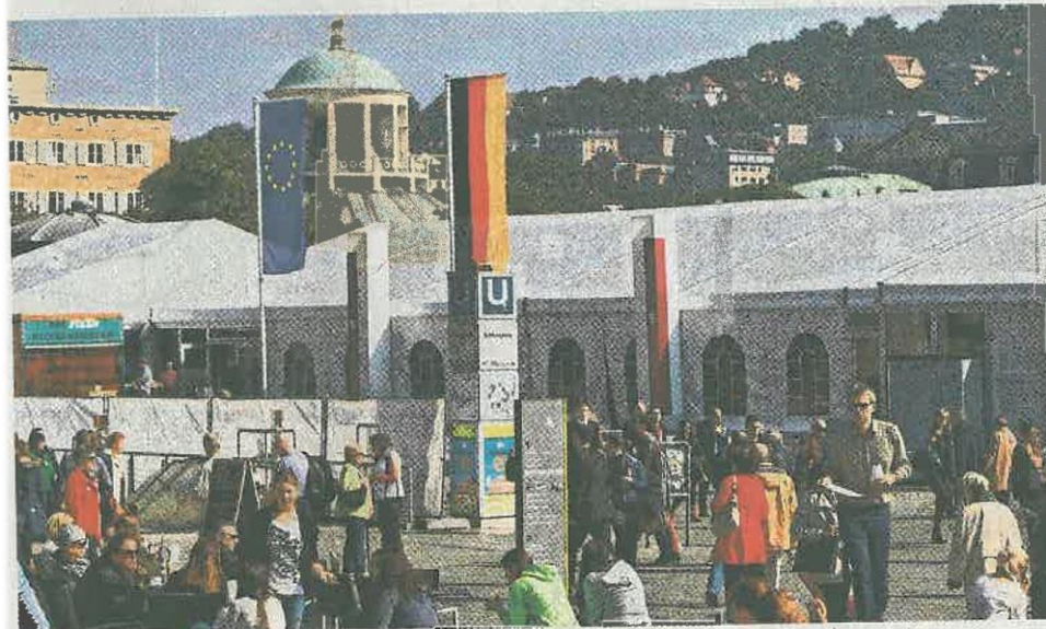
2012 ist der Tag der Deutschen Einheit groß in München gefeiert worden (oben); in Stuttgart hält erstmals Joachim Gauck als Bundespräsident die Ansprache.