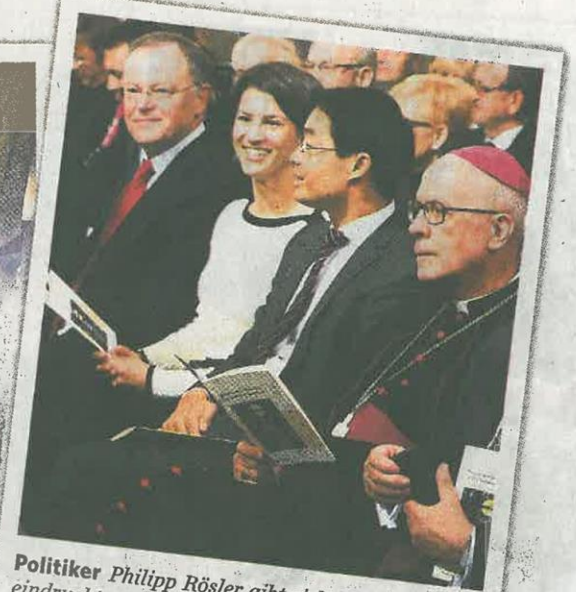
Politiker Philipp Rösler gibt sich äußerlich unbeeindruckt von der Wahlniederlage der FDP. Der niedersächsische Ministerpräsident Stephan Weil (links) übernimmt von Winfried Kretschmann den Vorsitz des Bundesrats. (era)