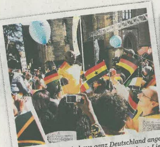
Chor 50 Sänger sind aus ganz Deutschland angereist, um vor der Stiftskirche ein besonderes Lied anzustimmen: eine Kombination aus „Kein schöner Land“ und dem afrikanischen „Nkosi Sikelel i Afrika“ („Gott schütze Afrika“). (rec)

STUTTGARTER ZEITUNG Nr. 230 | Freitag, 4. Oktober 2013