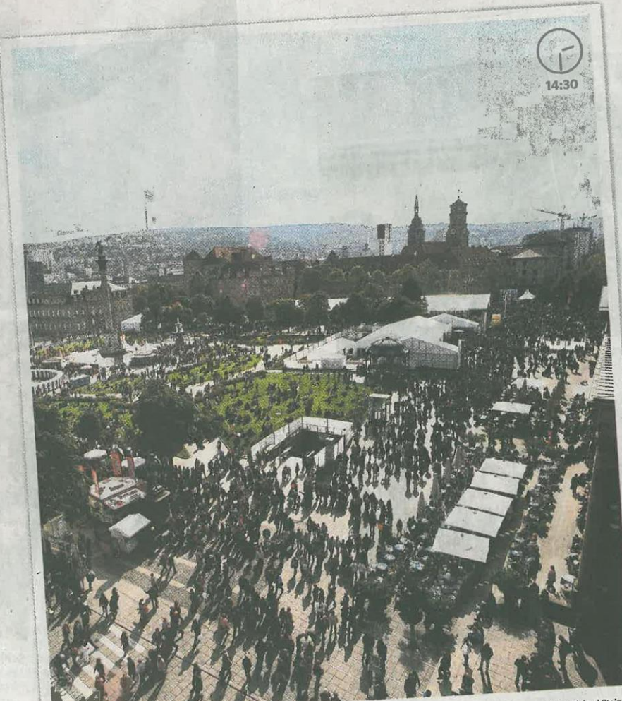
Schlossplatz Die Masse macht's: Besuchermengen strömen durch die Stadt.