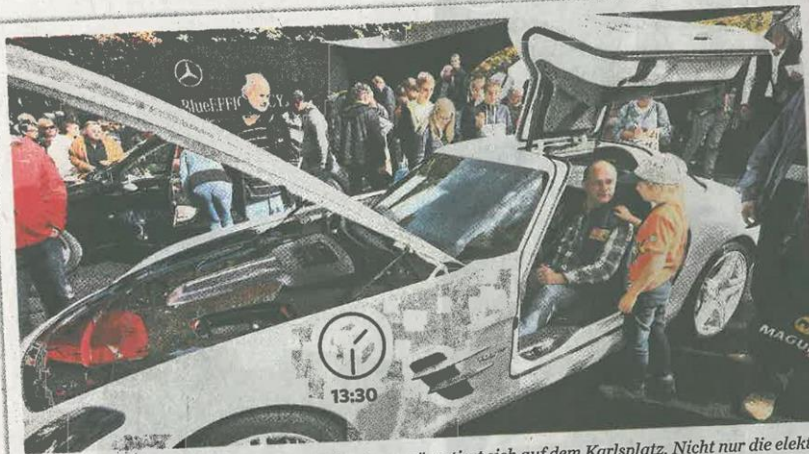
Karlsplatz Die Innovationskraft des Südwestens präsentiert sich auf dem Karlsplatz. Nicht nur die elektrisch betriebenen PS-Boliden von Daimler ziehen die Menschen in ihren Bann. Viele Besucher interessieren sich auch für hochmoderne Wasseraufbereitungsanlagen oder E-Bikes. Bei einer Ideensammlung des Landes machen etliche Bürger selbst Vorschläge für mehr Nachhaltigkeit im Alltag. (rec)

3. Oktober Erst treffen sich die geladenen Gäste in der Stiftskirche, dann geht es mit dem Shuttlebus weiter in die Liederhalle. Dort macht die Berliner Politprominenz Bekanntschaft mit dem Bahnhofsprotest. Die Bürger nutzen die vielfältigen Angebote in der Stadt, die Einheitsfeier endet mit einem Konzert. Von unserer Redaktion