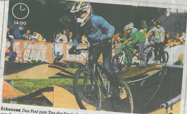
Eckensee Das Fest zum Tag der Deutschen Einheit lässt auch die Kinder an die Macht. Die jungen Besucher können aus einer Vielzahl von Angeboten auswählen. Vor allem im Bereich „Neugier trifft Bewegung“ rund um den Eckensee kommt der Nachwuchs auf seine Kosten. Viel Spaß haben junge Zweiradfreunde auf dem von der Bürgerstiftung geförderten mobilen Pumptrack des Stadtjugendrings, auf dem sie mit viel Tempo ihre Runden drehen. (rec)