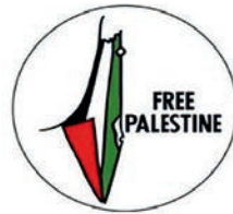
Palästinensische Flagge in den Grenzen Israels

Beispiele verdeutlichen dies: Es handelt sich nicht mehr um bloße Kritik am Staat Israel, sondern um israelbezogenen Antisemitismus, wenn zum Beispiel das Existenzrecht Israels verneint wird, wenn zur Beschreibung Israels oder seiner Bevölkerung Bilder oder Symbole verwendet werden, die mit traditionellem Antisemitismus in Verbindung stehen, wenn Jüd:innen kollektiv für die Handlungen des Staates Israel verantwortlich gemacht werden oder wenn israelische Politik mit nationalsozialistischer Politik verglichen wird.