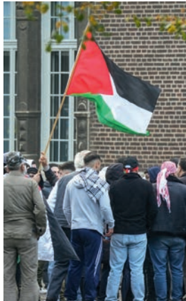
Pro-Palästinensische Demonstration in Bremen

Außerhalb dieses Kontextes ist es dahingegen legitim, für die Selbstbestimmung des palästinensischen Volkes und dessen Rechte zu demonstrieren oder auf die humanitäre Lage, insbesondere im Gazastreifen, aufmerksam zu machen. Allerdings kann es in diesem Zuge auch zu Aussagen und Parolen kommen, die als antisemitisch einzustufen sind. Teilweise stehen dahinter islamistische Akteur:innen, die versuchen, die Demonstrationen für ihre Zwecke zu vereinnahmen. Ihre Kritik an Israel macht sie anschlussfähig an Milieus, die selbst nicht islamistisch, jedoch tendenziell israelfeindlich eingestellt sind.