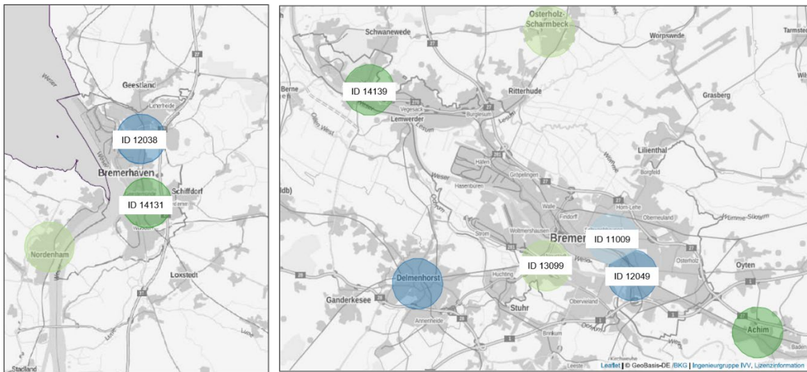
Abbildung 2: Position der Suchräume für Deutschlandnetz-Schnellladepunkte in Bremen und Bremerhaven (Quelle: Ingenieurgruppe IVV, https://www.standorttool.de/strom/deutschlandnetz/ )