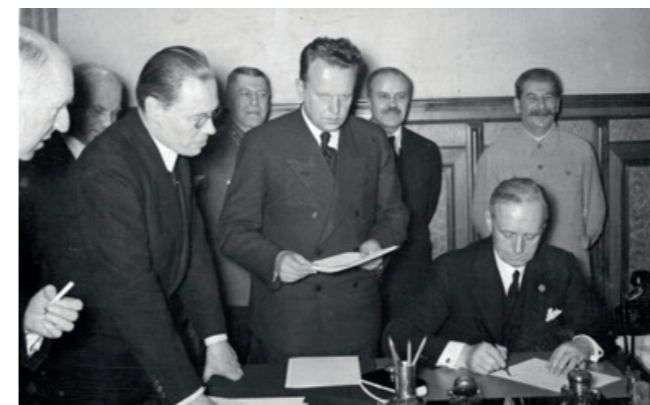
Unterzeichnung des „Hitler-Stalinpaktes“ im September 1939

Trotz des Versailler Vertrages begann man ab 1935 mit der Aufrüstung deutscher Truppen und damit einer gezielten Kriegsvorbereitung. Nach dem Anschluss Österreichs, der Eingliederung des Sudetenlandes von 1938 an das Deutsche Reich, sowie der Errichtung des Protektorats Böhmen und Mähren, planten Hitler und seine Generäle den Überfall auf das Nachbarland Polen.