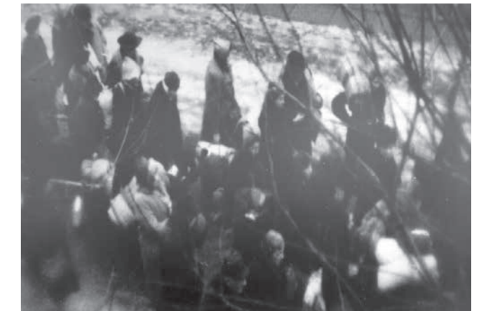
Heimlich fotografiertes Todesmarsch nach Rumbula (8. Dezember 1941)

Dann ließ Jeckeln im Ghetto die Nachricht verbreiten, dass eine Verlegung der Ghettobewohner in bessere Unterkünfte bevorstünde. Am 30. November 1941 wurden unter Mitwirkung von lettischen Hilfspolizisten etwa 13.000 Männer, Frauen und Kinder in Richtung Rumbula getrieben.