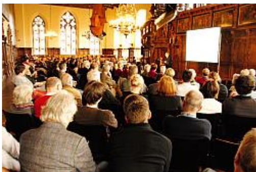
Der Deutsche Sonderweg?

08.05.2014 Mehr als 26 volle Stellen und jeweils rund 350.000 Euro zusätzlich kann die Senatorin für Soziales, Kinder, Jugend und Frauen in den Jahren 2014 und 2015 für die Integration von Flüchtlingen aufwenden. Die Hälfte der Finanzmittel muss sie im eigenen Ressort erwirtschaften, die andere Hälfte stellt die Senatorin für Finanzen zur Verfügung. MEHR