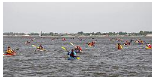
Bremen maritim: Ende Mai paddeln Hunderte bei der 27. Weser-Tidenrallye mit den