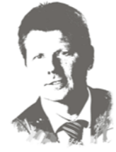
Ihr Joachim Lohse Senator für Umwelt, Bau und Verkehr

das Automobil hat die Städte geprägt und bestimmt das alltägliche Leben. Es bietet die Freiheit, spontan und ohne Vorbereitung zu fahren, wohin man will. Es ist aber auch eine Last - durch Lärm, Luftverschmutzung, zugeparkte Straßen und breite Verkehrsschneisen, die die Städte zerteilen. Eine Stadt, in der nicht das Auto dominiert, mit mehr Platz für das Leben in den Straßen und mehr Raum für die Bewohnerinnen und Bewohner und ihre Gäste - ein Traum! Zum „autofreien StadTraum“ werden am 16. September der Rembertiring und die ihn umgebenden Straßen - inklusive der Hochstraße. Ein Tag lang toben hier Kinder - und nicht der Verkehr. Der städtische Raum wird zurückerobert und anders genutzt - zum Spielen, Tanzen, Klettern und Skaten. Und nicht zuletzt bietet die Hochstraßentour des ADFC Radfahrerinnen und Radfahrern am gleichen Tag das Erlebnis, einige große Bremer Verkehrsachsen ohne motorisierten Verkehr zu erleben. Ich lade Sie sehr herzlich ein zum autofreien StadTraum am 16. September 2012. Bringen Sie Ihre Familie und Ihre Freunde mit und entdecken Sie einen sonst eher ungemütlichen Stadtraum ganz neu. Ich wünsche Ihnen viel Spaß dabei.